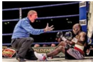
(Ausschnitt aus der Sequenz „Boxkampf“ von Eric T'Kindt, Orroir/Belgien, 1. Platz | 8. Medienfestival 2015)